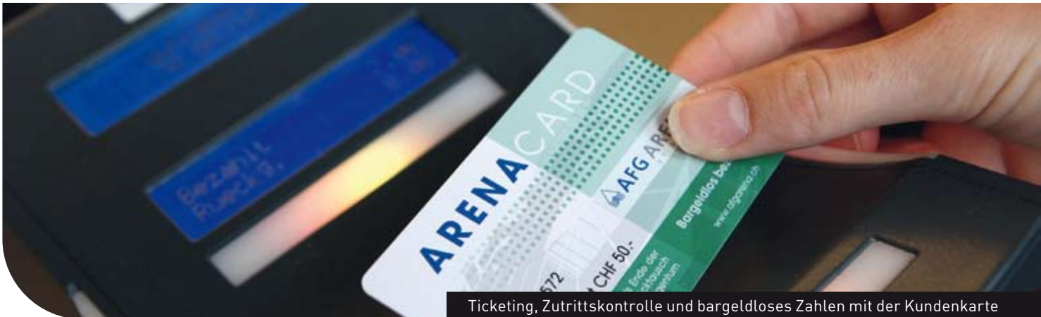
Ticketing, Zutrittskontrolle und bargeldlos Zahlen mit der Kundenkarte

jet ticket gilt als das führende Inhouse-Ticketing-System in Europa. Eine Vielzahl von renommierten Kultur- und Sportveranstaltern sowie Ausstellungsbetrieben aus dem gesamten deutschsprachigen Raum setzen auf jet ticket für reibungslose Prozesse im Ticketing. Ganz nach der Devise: Höhere Effizienz, mehr Überblick, bessere Verkaufszahlen.