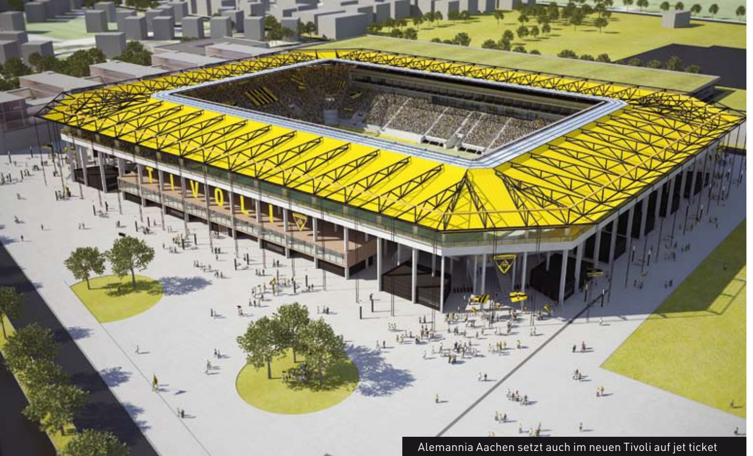
Alemannia Aachen setzt auch im neuen Tivoli auf jet ticket

Zusätzlich werden folgende Schnittstellen angeboten: