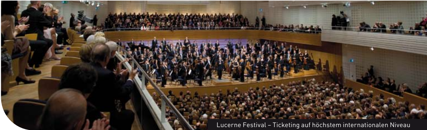
Lucerne Festival – Ticketing auf höchstem internationalen Niveau

Das jet ticket Standardpaket erfüllt höchste Anforderungen von Veranstaltern aus allen Sparten.